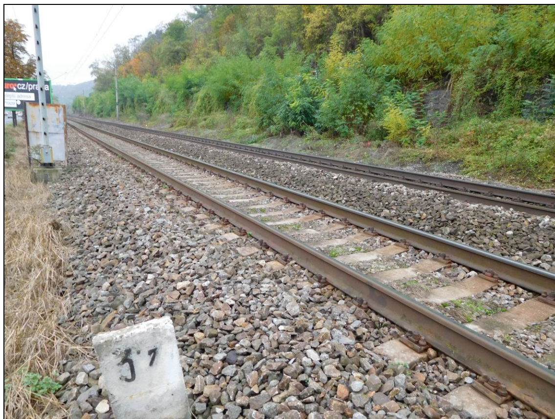
Obr. Situace v km 3,7