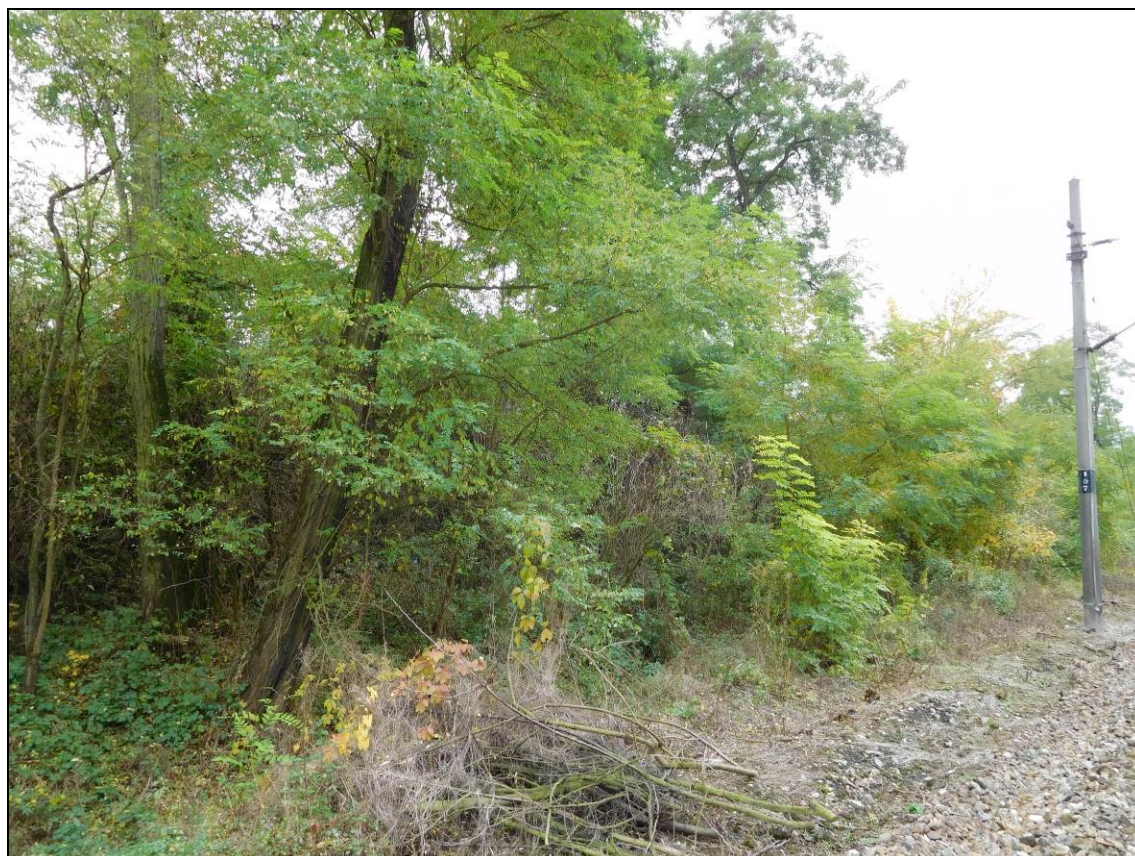
Obr. Situace v km 5,3