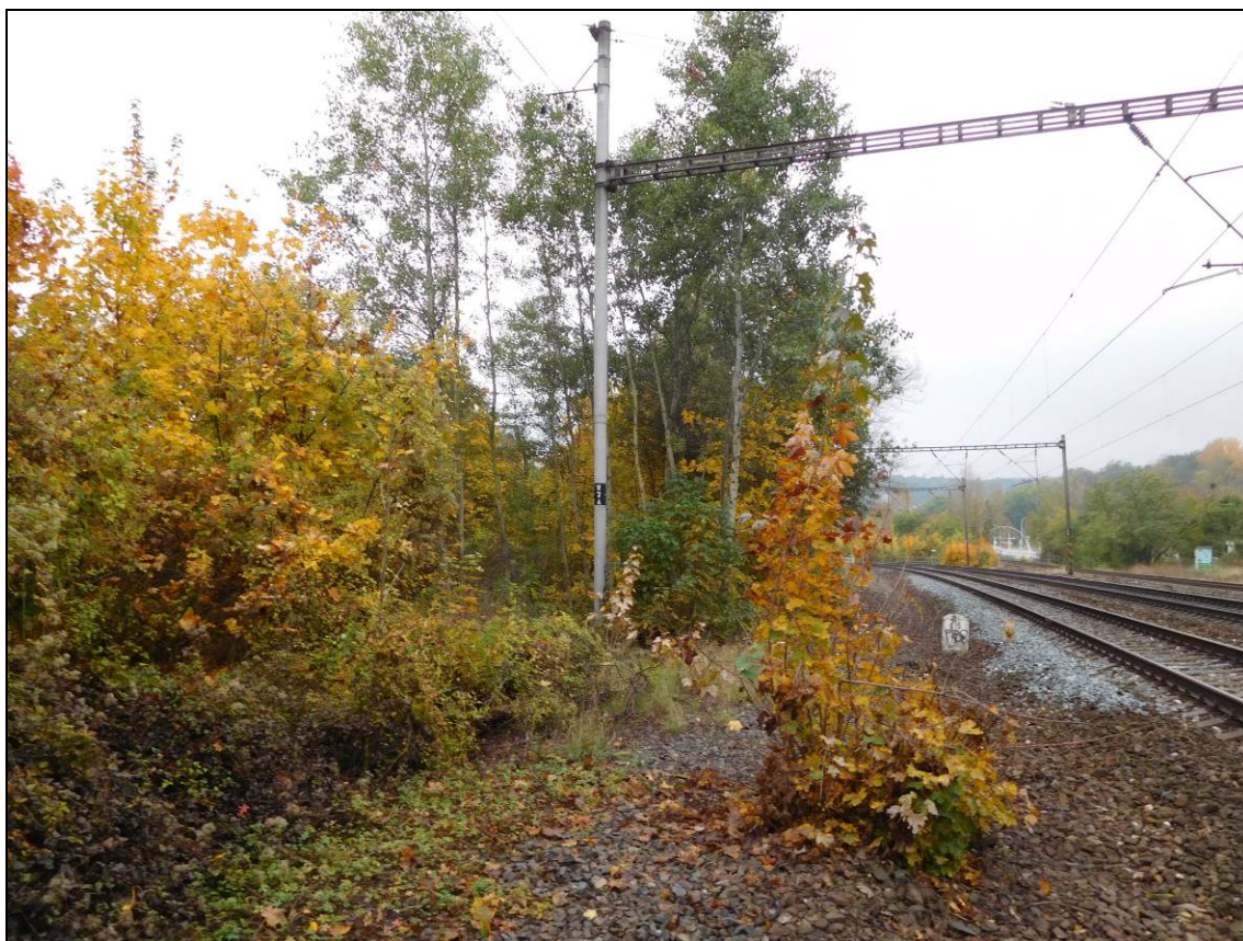
Obr. Situace v km 2,5