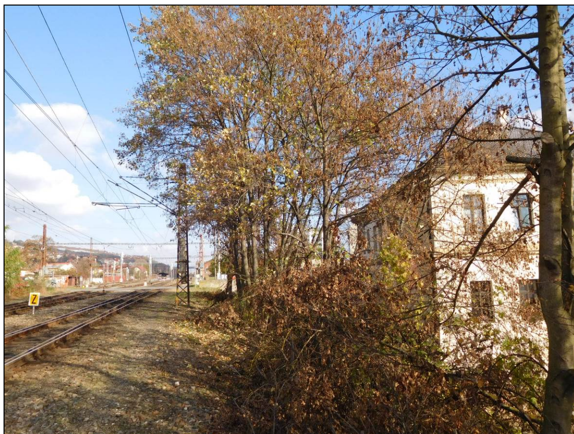
Obr. Radotín, za restaurací Portland