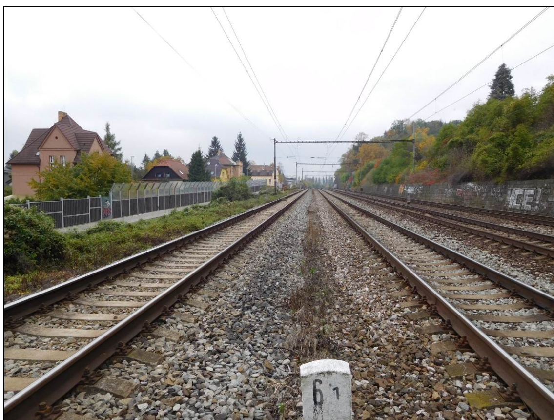
Obr. Situace v km 6,1