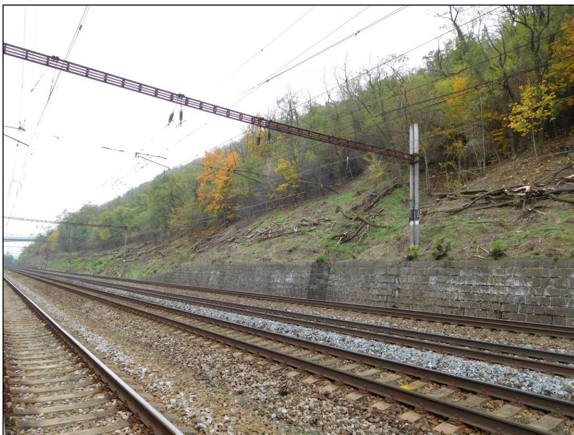
Obr. Situace v km 7,9