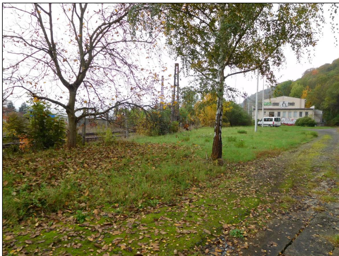
Obr. Trakční měnírna v Chuchlí