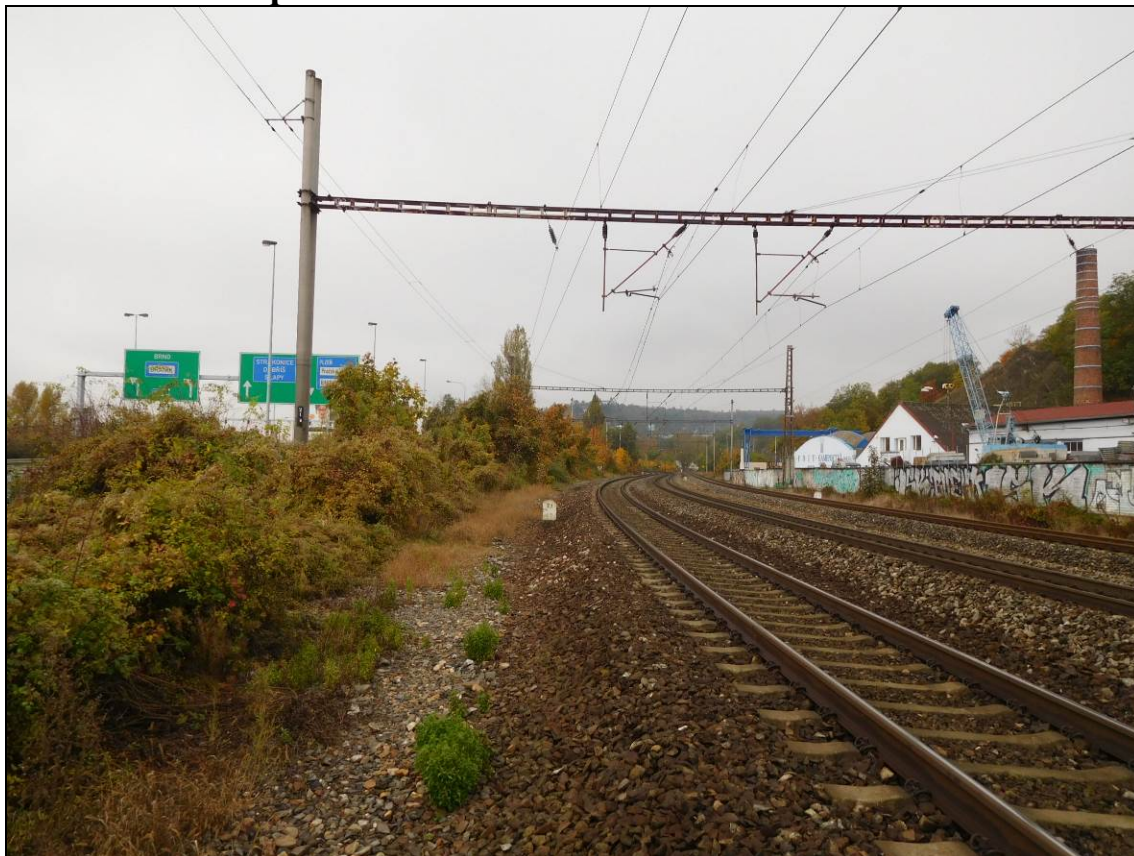
Obr. Situace v km 2,3