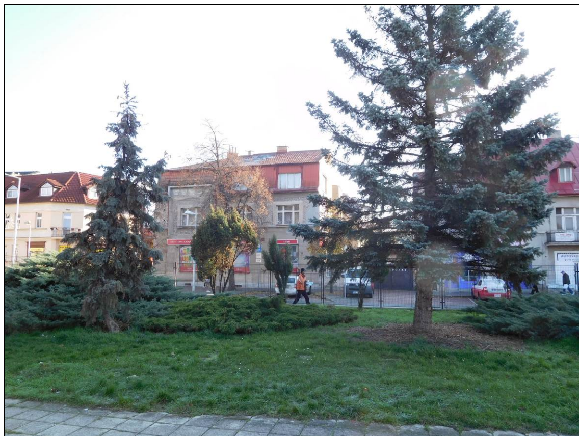
Obr. Žst. Radotín